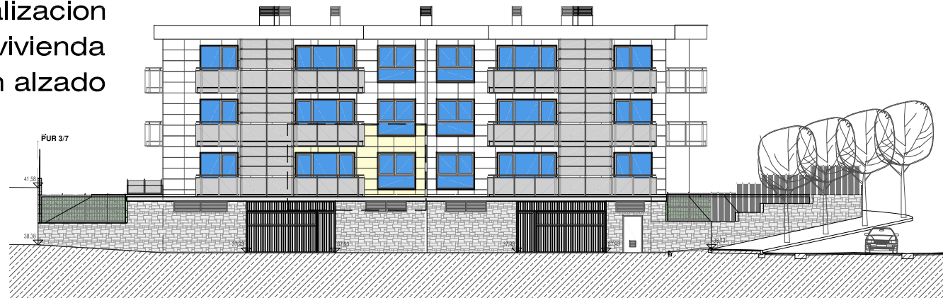
localización de la vivienda en alzado